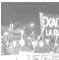
Marchas de las antorchas UNLP 21/08/01

Desde las primeras marchas se definió claramente el reclamo y su relación con el gobierno. A pesar de no contar con estrategias visuales tendientes a visibilizarlo ocupó importante espacio en la prensa local.