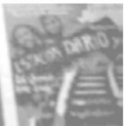
Zanon, Estación Darío y Maxi - 2002

identificación. Imagen que será registrada reiteradamente en la prensa local, la cual por su parte comienza a marcar el carácter periódico de las manifestaciones. A partir de abril de 2007, concurrentemente las marchas dejan de aparecer en la portada del diario impreso 28 . Las murgas acompañan de forma visible a partir de 2001 las diferentes movilizaciones de derechos humanos, ubicándose generalmente en la cabecera.