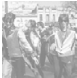
Murga - noche de los lápices 16/09/04