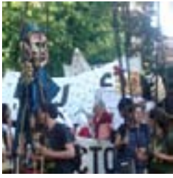
Performance – 18/11/07