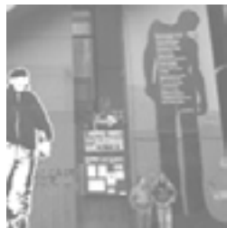
Escombros, septiembre 2005