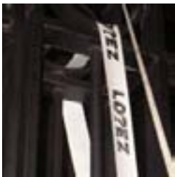
Cinta rodeando la Gobernación 18/05/08

Etchecolaz. El recurso tendrá amplia difusión en los medios locales y nacionales y es interpretado por el propio artista: