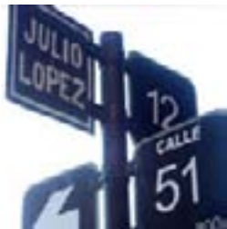
Cambio de denominación de las calles – 18/11/07