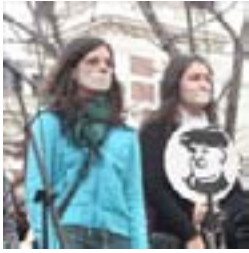
Instalación Contra-Silencio 18/09/08