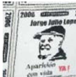
Fa.Sin.Pat. - 18/09/07