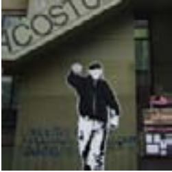
Figurón 7 y 48, 18/09/08