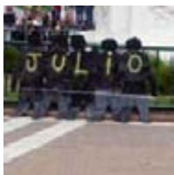
Siluetas negras del 17/01/07 reutilizadas en Capital el 18/01/07