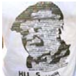
Remera de Hijos 13/09/08