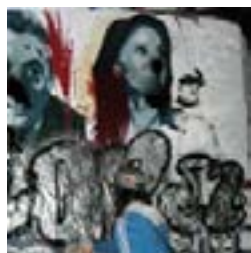
Escrache al Mural 9 y 53, 10/09/08

tiene una extensa tradición, y en la ciudad de La Plata recientemente una intensa actividad 55 .