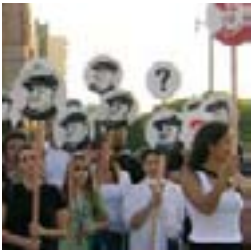
Instalación del Colectivo Siempre 18/03/07