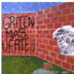
Mural 137 y 64, 10/09/08