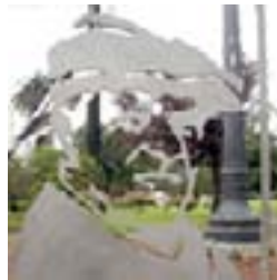
Astilleros - 18/09/07