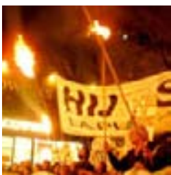
Marchas por López 18/05/07