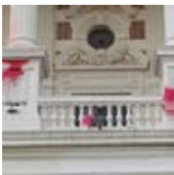
Escrache casa de Gobierno 18/03/07