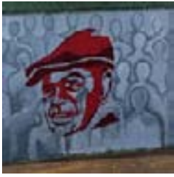
Mural 2 y 532, 14/09/08