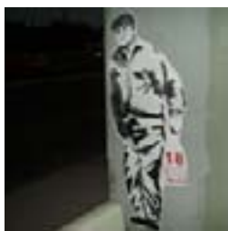
Figurón de López 28/03/08