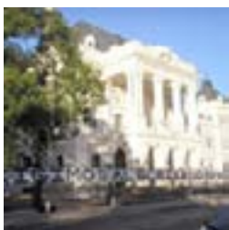
Bandera de 50 mts 18/03/07

marcha como en campañas masivas de pegatinas en la ciudad.