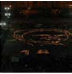
Velas dibujando el rostro de López 18/03/08