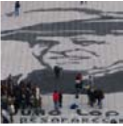
Rostro de López 18/06/08