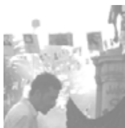
Fotocopias en la marcha 24/03/06