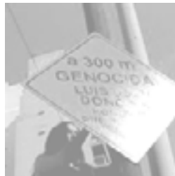
GAC en 2003