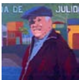
Mural Diag. 79, 116 y 117, 08/10/06

madres portando los pañuelos-pañales pasando por las siluetadas, los escraches a genocidas durante la década del '90, hasta la estación "Darío y Maxi". Han tenido múltiples funciones dentro del espacio de las reivindicaciones sociales, que pueden ir desde formas propias de contención de los grupos vulnerados hasta estrategias para dar visibilidad a los reclamos. Cada hipótesis requeriría un estudio en particular y no sería extraño que una misma acción cumpliera funciones en varios niveles.