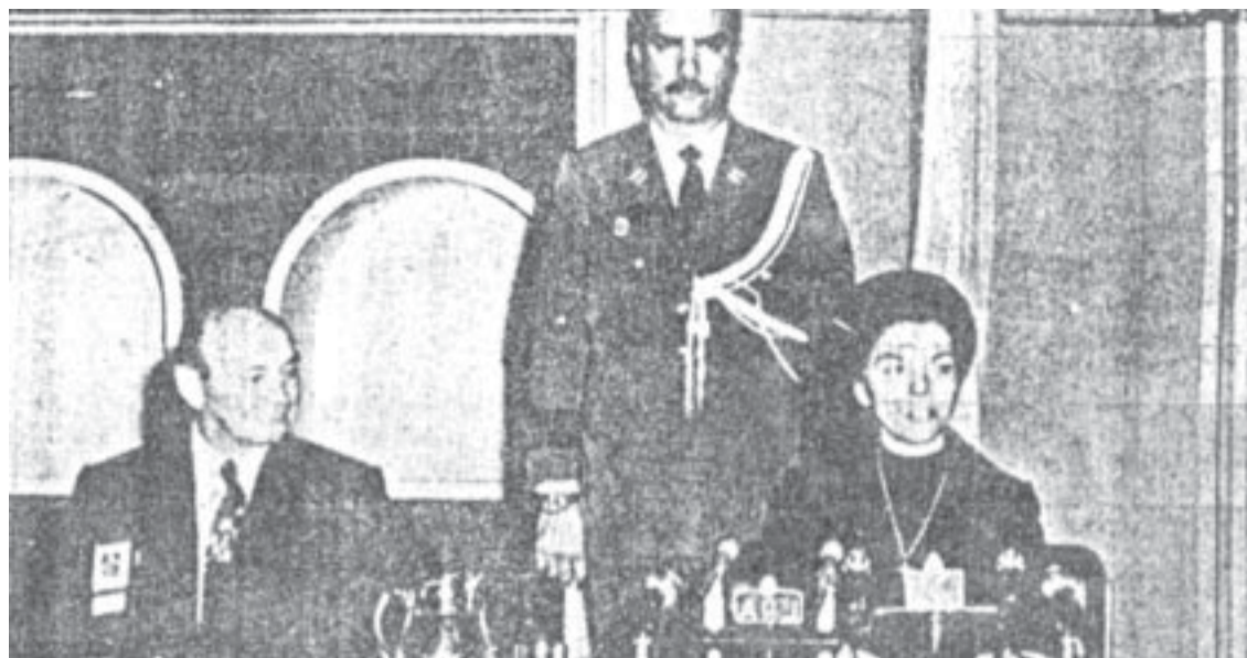
CELESTINO RODRIGO E ISABEL PERÓN

En la sección Nuestra Historia de este número presentamos un hito fundamental de la historia de la clase obrera argentina: la huelga general contra el gobierno de Isabel Perón y el surgimiento de las coordinadoras obreras.