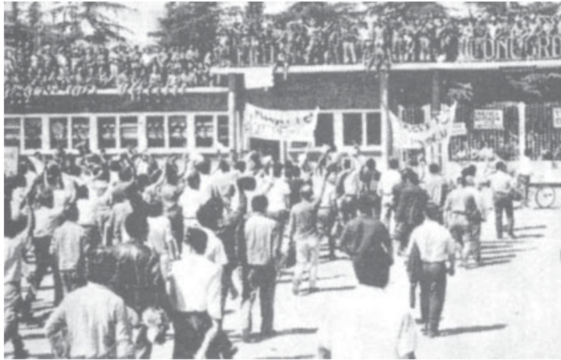
CONCORD, TOMA DE FÁBRICA DE ENERO DE 1971