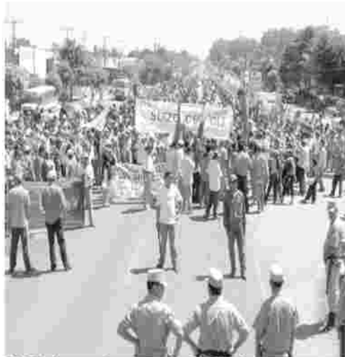
El 20 de noviembre de 2008, los campesinos de Suizo Kue se manifiestan.

Resultado: enviaron la Brigada Antimotines de la Policía Nacional de Paraguay para que destruya los cultivos del asentamiento y la escuela.