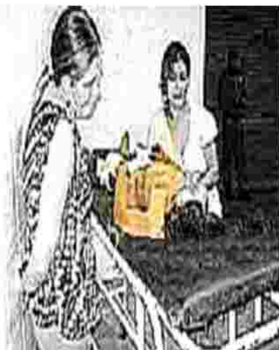
Uno de los niños asesinados en Concepción por los escuadrones de la muerte integrados por policías ( ABC COLOR 14 7 2008 )