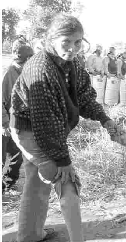
Represión en Suizo Kue el 31 de mayo de 2008.

Los dueños del poder real aún reprimen salvajemente a los campesinos movilizados en los asentamientos de tierras recuperadas y en las calles de las ciudades donde manifiestan su descontento.