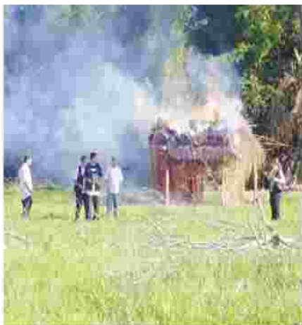
El 27 de noviembre de 2008, por si hiciese falta "Claudes" y los fiscales, volvieron a quemar hogares de los campesinos en un operativo que terminó con 22 detenciones

Los campesinos solo se quedaron con el hecho consumado y el lamento, porque este juez " desoyó un requerimiento de suspensión del desalojo por parte del Indert que aparentemente pretende tardíamente reiniciar las negociaciones." (ABC COLOR, 29 - 5 - 2008)