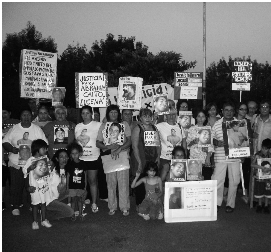
Madres y familiares víctimas del gatillo fácil.

siguiendo su ejemplo, las madres de las víctimas del genocidio en democracia: el gatillo fácil, la violencia institucional, la inseguridad, la trata, la droga y la corrupción, se sobreponen a diario al miedo y al dolor individual, rechazando ofertas para comprar su bandera, y en la total inexperiencia política abandonan el terreno doméstico para ganar las calles, foto en pecho y pancarta en mano, superando el abandono del Estado, uniéndose en el dolor y en la valentía, buscándose en la soledad y la lucha, para encarar, de una vez y para siempre, el camino de la pelea por justicia por los hijos de todas, por los que estuvieron, por los que están y por los que siempre estarán. Madres que irrumpen en prostíbulos para rescatar chicas secuestradas por las redes de trata arregladas con punteros, policía y poder judicial.