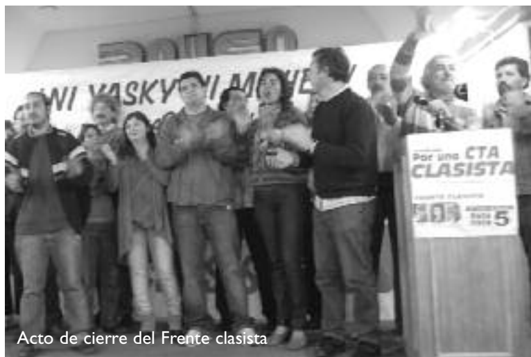
Acto de cierre del Frente clasista

dical sino política , llamando a construir un camino de independencia de clase.