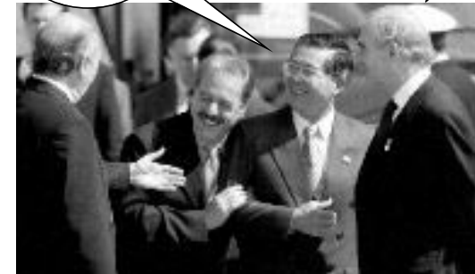
Lagos, Pastrana, Fujimori, De la Rúa en Brasilia, cuando se aprobó el IIRSA. Algunos de estos presidentes no terminaron demasiado bien sus mandatos