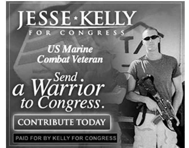
Afiche del candidato republicano que en su campaña llamó a descargar un M16 en el cuerpo de la senadora Giffords.

Barak Obama, Sarah Palin, George Bush... todos son responsables del atentado contra Gabrielle Giffords y de la muerte de los miles de inmigrantes latinoamericanos, la mayoría de los cuales ni siquiera llegan a