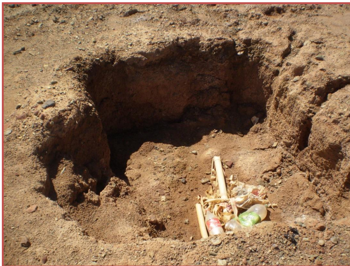
Una calicata abierta dejada por la consultora CESEL en el terreno del Barrio 12 de Octubre. Al fondo se ven tubos de PVC dejados por la consultora. Clínica de Derechos Humanos. Abril 2011.

La Clínica documentó deficiencias en el trabajo de campo llevado a cabo por CESEL para la evaluación de la contaminación ambiental en Abra Pampa. Parte del trabajo de campo de la compañía consultora fue abrir calicatas que no cubrieron completamente después de finalizar el muestreo. Las calicatas que quedaron abiertas tienen una profundidad variable y según reportan residentes han causado accidentes de personas y animales al caer dentro de éstas. A la falta del relleno de las calicatas, se añade que el acordonamiento de plástico y tubos de PVC utilizados por la compañía consultora no fueron retirados de los sitios de estudio, contribuyendo a su contaminación y no a su limpieza.