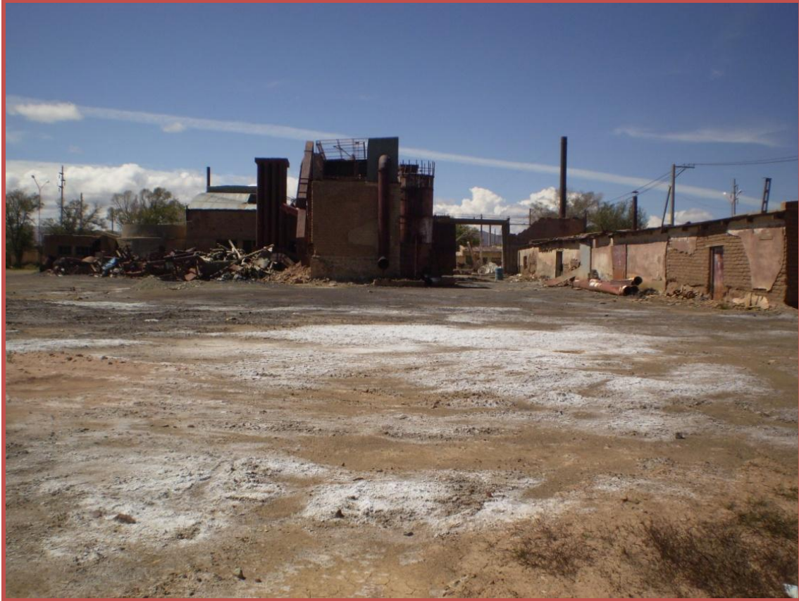
El predio de la ex fundición Metal Huasi dos años después de la remoción de montaña de desechos metalúrgicos. Aún se ven los humos blancos sobre el suelo. Clínica de Derechos Humanos. Abril 2011.

Para el desarrollo de la primera etapa del plan de remediación, en enero de 2010 se llevó a cabo una licitación para la contratación de la compañía consultora que evaluaría y diseñaría el plan de remediación ambiental. 21 Sin embargo, GEAMIN no ha hecho público la información sobre los procesos de la licitación, los estándares utilizados para la elección de la compañía, ni cuáles compañías fueron consideradas, aunque el préstamo estipula que la información sobre los procesos de la licitación debe estar disponible en un portal único electrónico de libre acceso y accesible al BID. 22 Así fue seleccionada la empresa peruana CESEL para la evaluación y diseño del plan de remediación.