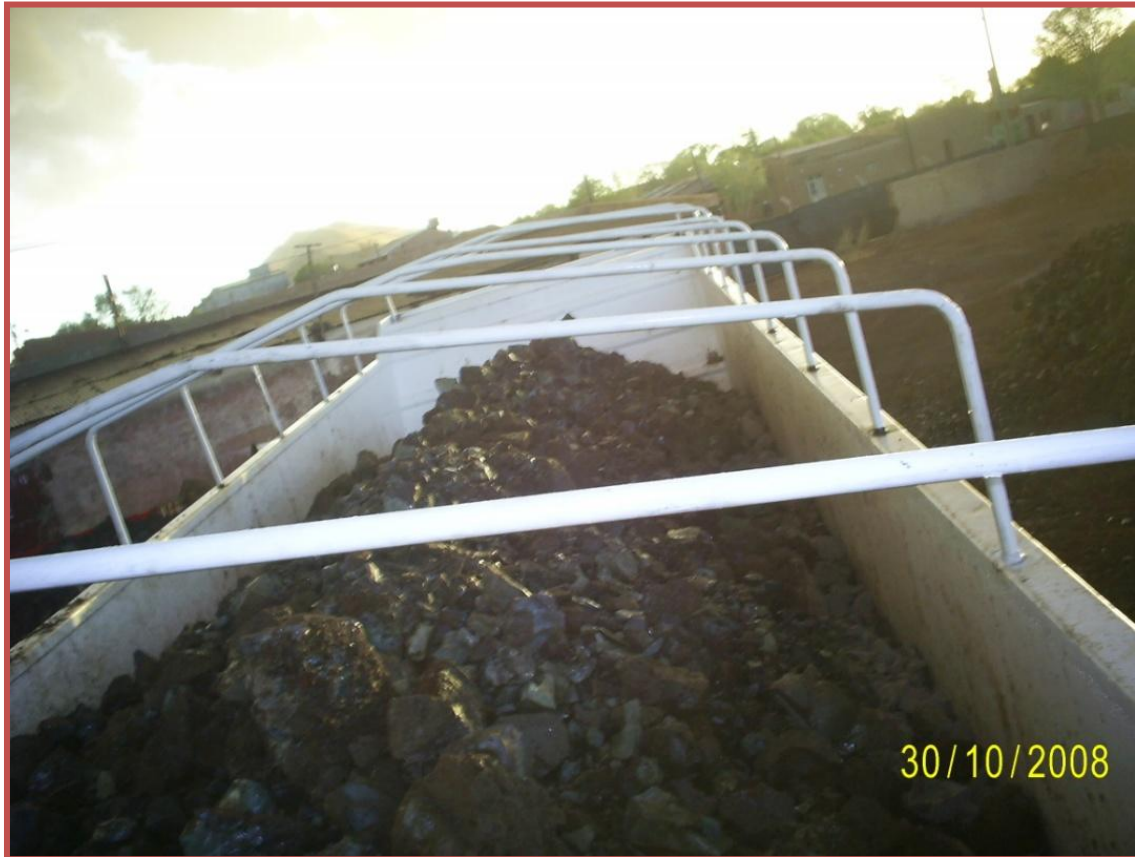
Traslado de pasivos ambientales del predio de la ex fundición Metal Huasi a Mina Aguilar sin protección para evitar la dispersión de los pasivos por la ciudad. Octubre 2008.

el establecimiento de los términos de referencia para la ejecución de la obra de remediación. 19 La segunda etapa tomará como base la información establecida en la primera parte para su ejecución. 20