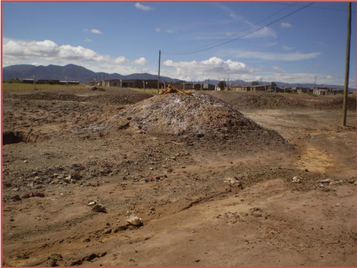
Terreno en el Barrio 12 de Octubre con toneladas de desechos metalúrgicos. Al fondo se observan viviendas expuestas a los polvos tóxicos. Clínica de Derechos Humanos. Abril 2011.

La negligencia gubernamental ha llevado a la violación del derecho a la salud y el derecho a un ambiente sano en Abra Pampa. Tan grave es la negligencia a la crisis sanitaria que un residente afirma que “los derechos humanos no existen en Abra Pampa.” 13 Esta emergencia sanitaria y ambiental requiere acciones inmediatas, apropiadas a su gravedad para la protección de la salud de toda persona que vive en la ciudad.