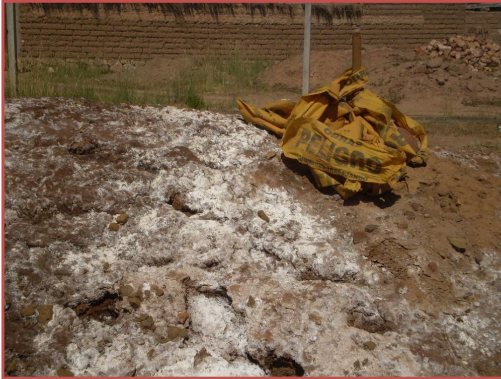
Acordonamiento de plástico dejado por la consultora CESEL en el terreno del Barrio 12 de Octubre sobre humos blancos y escorias. Clínica de Derechos Humanos. Abril 2011.

y la falta de consulta continuarán ya que GEAMIN presentará las tres alternativas para la obra de remediación a la municipalidad y la provincia, no a la población afectada. 34