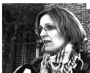
Candidata a Dip. Nacional ParlaSur / Río Negro