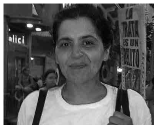
Candidata a Diputada Nacional / Prov. Buenos Aires

Compañeros/as de CS e independientes participarán en las próximas elecciones presidenciales en seis provincias o distritos electorales, integrando "Renovar el Frente de Izquierda con la fuerza de los trabajadores, de las mujeres y de la juventud", la lista encabezada por Nicolás Del Caño, Myriam Bregman y el PTS.