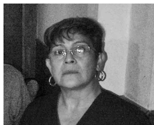
Candidata a Diputada 3ra Sección / Buenos Aires