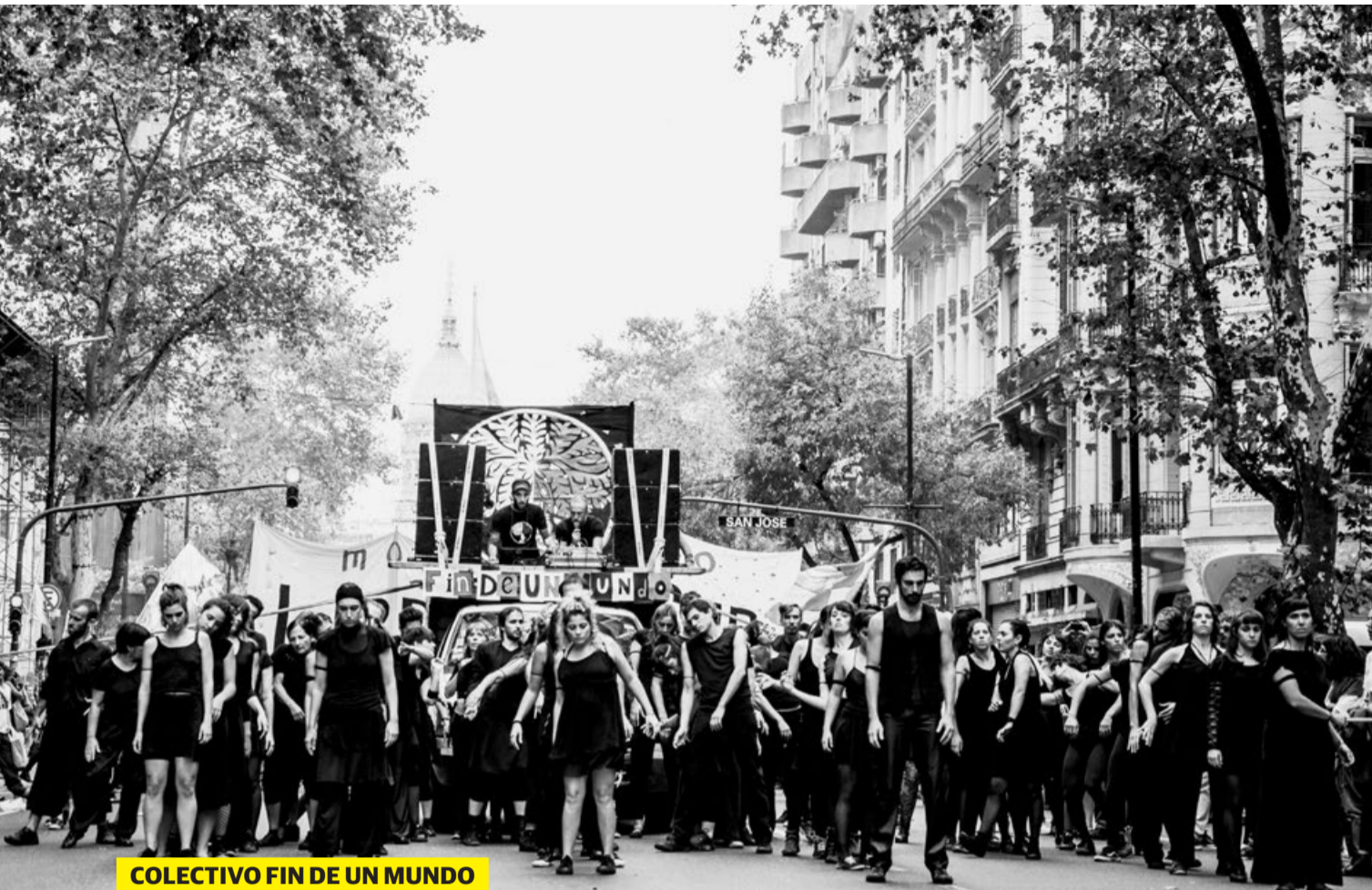
COLECTIVO FIN DE UN MUNDO