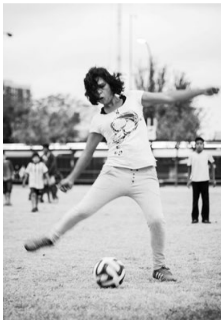
El entrenamiento es al aire libre. Buscan una cancha techada, para gambetear al frío.

de Argentina, Bolivia, Colombia, Chile y Uruguay.