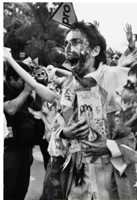
En la marcha del 24 de marzo y por los subtes como PROmbies: moverse en el espacio público para mover estructuras, pensamientos y acciones.

En un colectivo así, plural y diverso, entienden que lo que sobra son recursos hu-