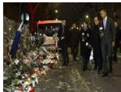
(Obama y Hollande frente al “Bataclan”, en París, el 30 de noviembre de 2015)

climáticos, sin que hagan mella a las ganancias de los capitalistas...! Pero esto no es decisivo: también están las decenas de toneladas de kerosene quemadas por los dos aviones utilizados por el presidente norteamericano en cada uno de sus viajes; a ellos se agregan las dos centenas de aviones que han venido de todos los confines de la tierra a la reunión mundial; cosa que no representa nada, comparado con lo que escupe en la atmósfera diariamente cientos de industrias y transportes en el mundo entero!